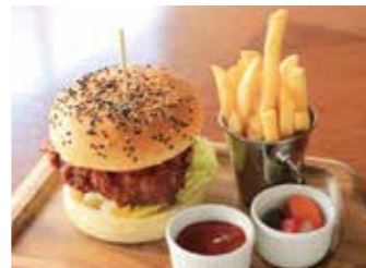
R.H.F.B (ROSE HOTEL YOKOHAMA FRIED CHICKEN TERIYAKI MAYO BURGER) R.H.F.B. (ローズホテル横浜 フライドチキン テリマヨバーガー)