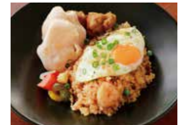
MILLY STYLE NASI GORENG ミリー特製 ナシゴレン