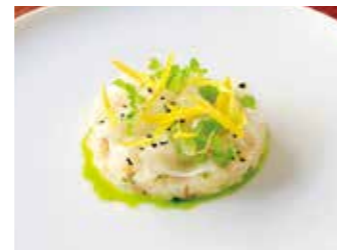
MARINATED AMBERJACK IN CITRUS カンパチのシトラスマリネ