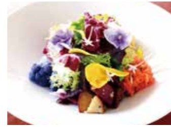
KANAGAWA VEGETABLES GARDEN SALAD 神奈川県契約農家のガーデンサラダ