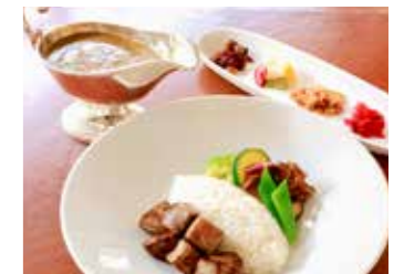
EUROPEAN BEEF CURRY WITH CUBED STEAK RICE サイコロステーキの欧風ビーフカレー