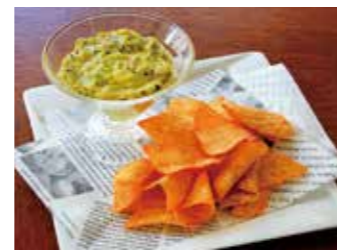
AVOCADO DIP & TORTILLA CHIPS アボカドディップ&トルティーヤチップス