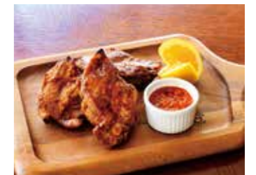
MATSUZAKA PORK BBQ SPARERIB IN ROMESCO SAUCE 松阪豚 BBQ スペアリブ ロメスコソース