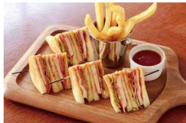
CLUB HOUSE SANDWICH クラブハウスサンドイッチ