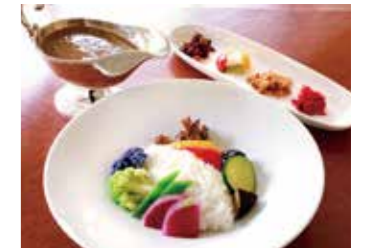
VEGETABLE COCONUT MILK CURRY ベジタブルココナッツミルクカレー