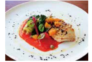
SAUTEED FISH OF THE DAY 本日鮮魚のソテー 本日の調理法で