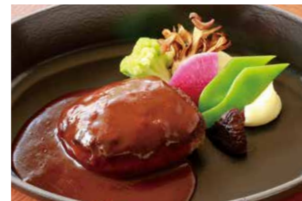
MILLY STYLE HAMBURG STEAK (200G) ミリー特製ハンバーグステーキ (200g)