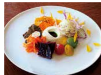
HOMEMADE RICOTTA CHEESE WITH MARINATED SEASONAL VEGETABLES AND BASIL OIL 自家製リコッタチーズ 季節野菜のマリネ バジルオイル