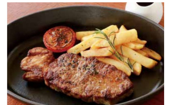
SIRLOIN STEAK (225G) 放牧牛のサーロインステーキ (225g)