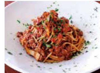
BOLOGNESE SPAGHETTI WITH MUSHROOM キノコ入りボロネーゼ スパゲッティ