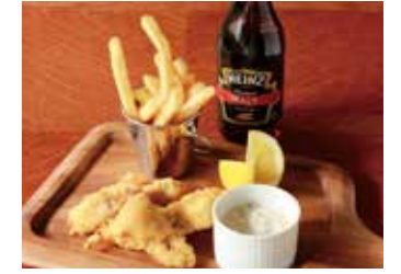
FISH & CHIPS WITH HOMEMADE TARTAR SAUCE フィッシュ&チップス 自家製タルタルソース