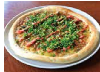
PIZZA WITH SHIRASU AND MENTAIKO シラスと明太子のピザ