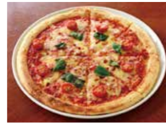
PIZZA MARGHERITA ピザ マルゲリータ