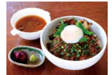
BEEF SIRLOIN STEAK OVER RICE ( WITH SOUP ) 牛サーロインステーキ丼 (スープ付)