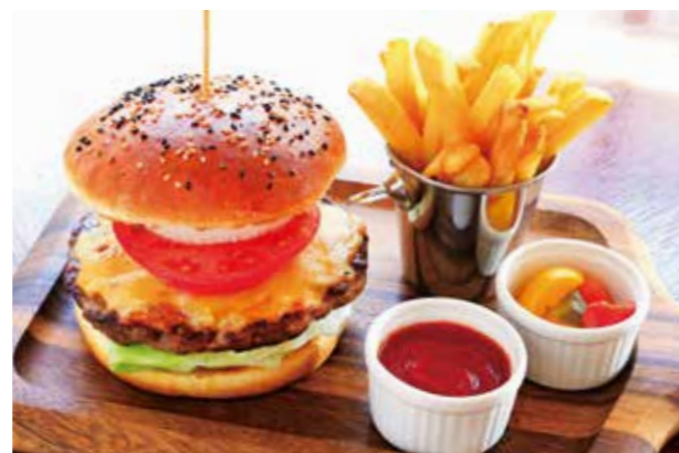
R. H. B. B. (ROSE HOTEL YOKOHAMA BEEF BURGER) R. H. B. B. (ローズホテル横浜ビーフバーガー)