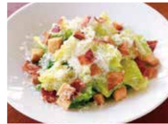
CAESAR SALAD シーザーサラダ