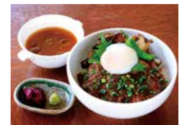
BEEF SIRLOIN STEAK OVER RICE (WITH SOUP) 牛サーロインステーキ丼 (スープ付)