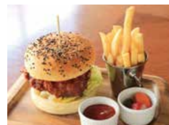
R.H.F.B (ROSE HOTEL YOKOHAMA FRIED CHICKEN TERIYAKI MAYO BURGER) R.H.F.B. (ローズホテル横浜 フライドチキン テリマヨバーガー)