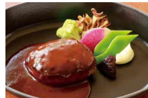
MILLY STYLE HAMBURG STEAK (200G) ミリー特製ハンバーグステーキ (200g)