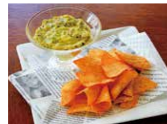
AVOCADO DIP & TORTILLA CHIPS アボカドディップ&トルティーヤチップス