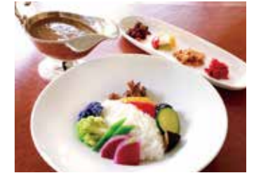
VEGETABLE COCONUT MILK CURRY ベジタブルココナッツミルクカレー