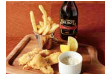
FISH & CHIPS WITH HOMEMADE TARTAR SAUCE フィッシュ&チップス 自家製タルタルソース