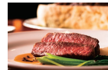
国産牛サーロインの塩釜焼き

毎年大好評のクリスマスディナー、今年は12/21~25の5日間の開催です。スターターから華やかな気分させてくれる、豪華なスペシャルメニューをご用意しました。魚介料理は、赤海老と帆立貝柱のちりめんきゅ包み蒸しを、キャビアクリームソースで、メイン料理は、国産牛サーロインの塩釜焼き、岩塩と卵と粉で作ったパン生地と林業でお肉を包み、オープンでじっくりと焼きあげ、風味豊かな